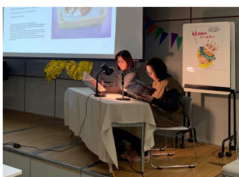
音声訳グループの朗読