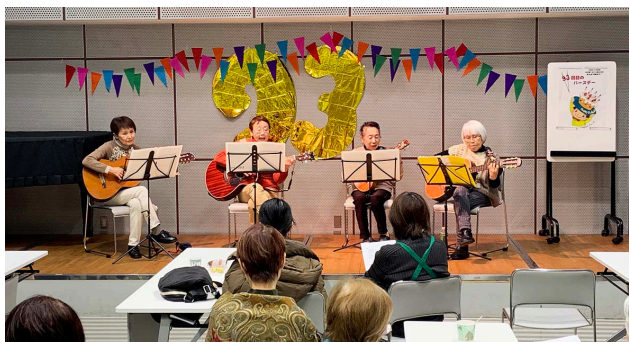
懐かしいフォークソング「ゼンザース」

名古屋YWCAの93回目のバースデーを祝うイベントを開催しました。100周年までのカウントダウンはさることながら、ふだん出会うことのない会員同士が顔を合わせて楽しく交流する機会を作ろうと企画しました。