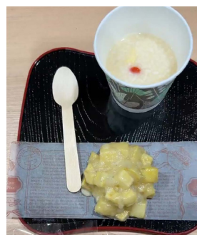
鬼まんじゅうと甘酒セット

名古屋YWCAの93回目のバースデーを祝うイベントを開催しました。100周年までのカウントダウンはさることながら、ふだん出会うことのない会員同士が顔を合わせて楽しく交流する機会を作ろうと企画しました。