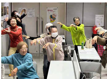
みんなで盆ダンスを踊る